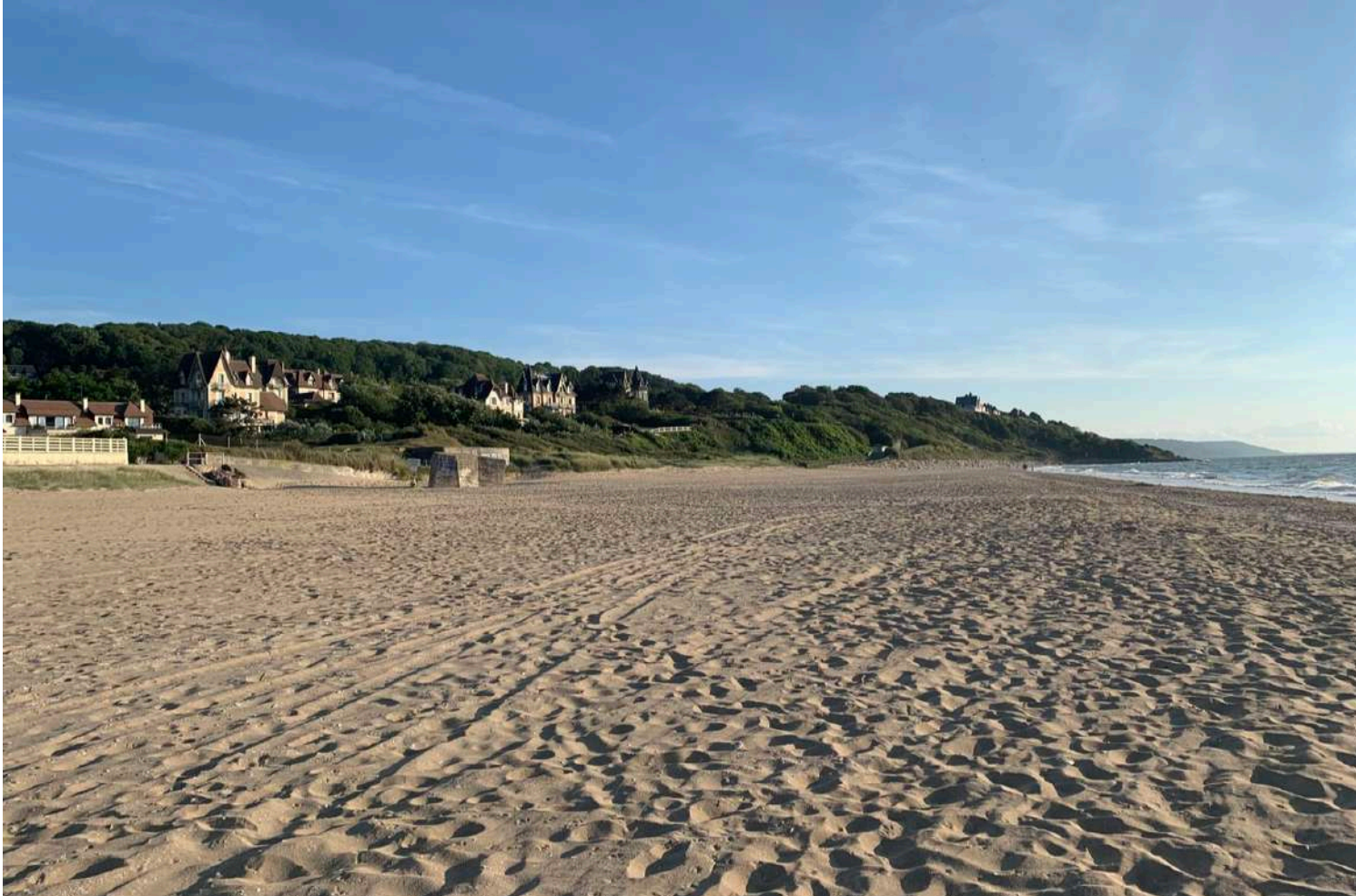
Plage de Benerville