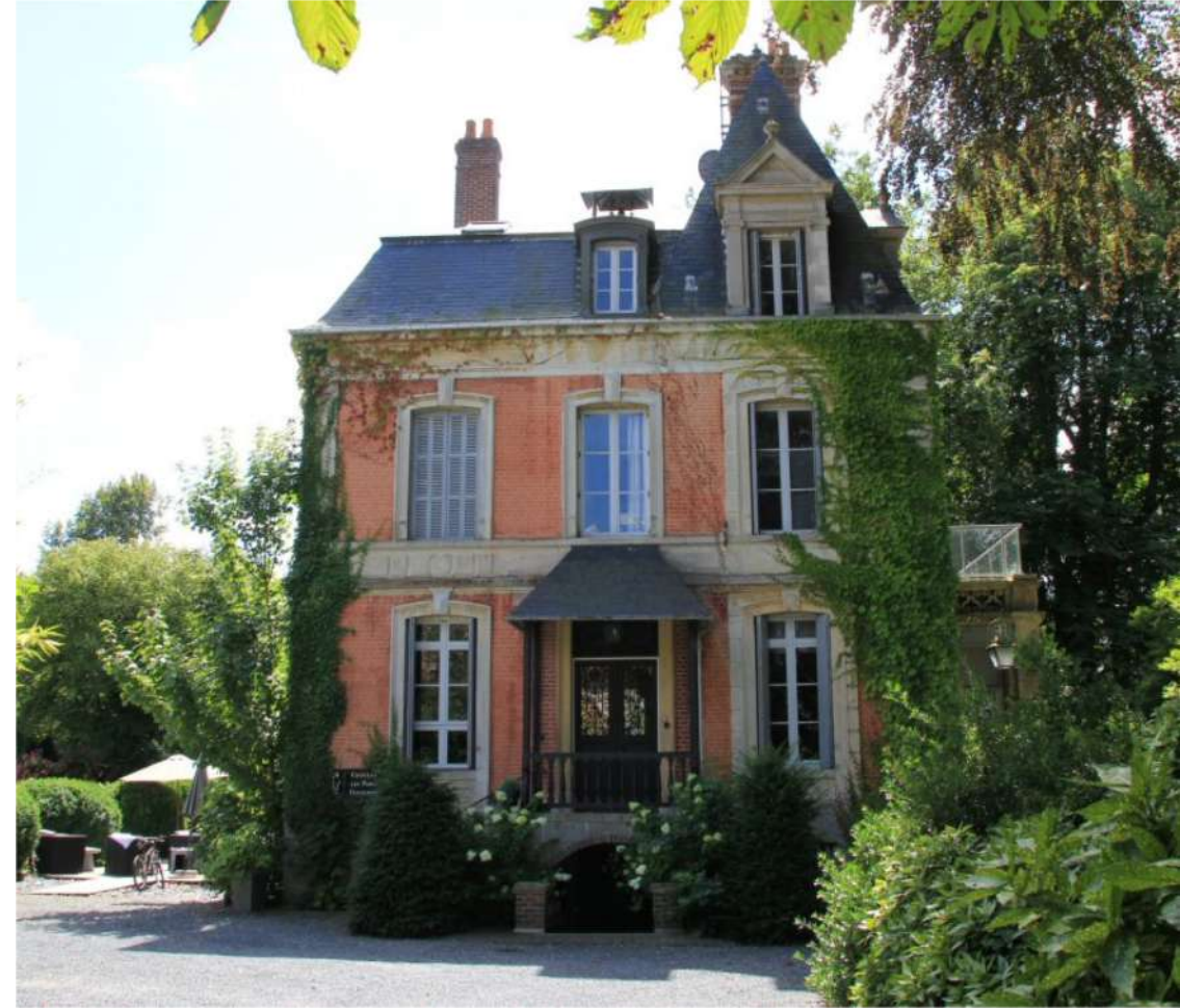
Château Les Parcs-Fontaines