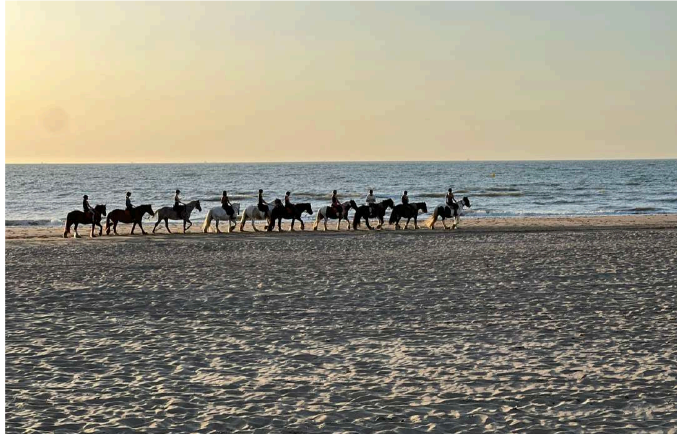
Plage de Deauville