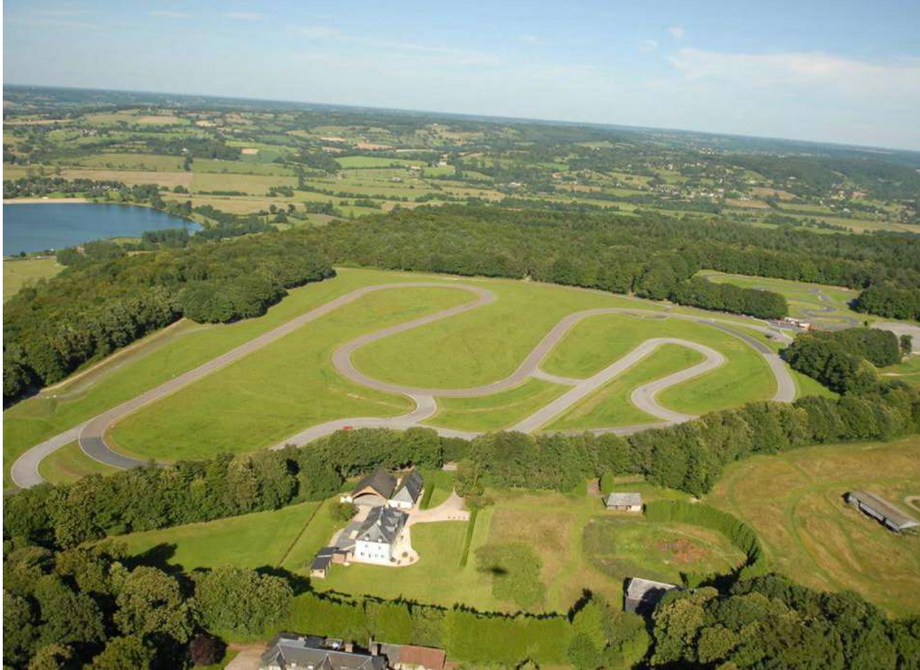
Circuit de Pont-L'Évêque