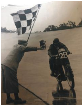
1948 - Georges Monneret à Montlhéry